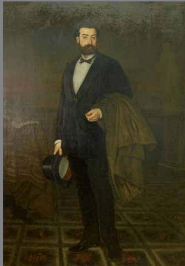
Pintura oli s/tela 138 x 196 cm 1871

Les obres, realitzades al 1871, són propietat de l'Ajuntament de Tortosa des de l'any 1978. Les dues peces han estat exposades a les escales principals de l'entrada a la Casa de la Ciutat. L'autor, Antoni Casanova Estorach (Tortosa 1847- París 1896), estudià a l'Escola de la Llotja de Barcelona fins que va ser pensionat pel comerciant Josep Vidal i Ribas, i es matriculà a la Escuela de San Fernando , a Madrid. Allí preparà la primera obra de gran format, gràcies a la qual va rebre una menció honorífica a l'Exposició Nacional el 1866. L'any 1870, tornà a Barcelona, i a l'Exposició d'aquell any guanyà una medalla i una pensió de la Diputació de Barcelona per anar a estudiar a Roma. Casanova treballà la pintura de tema històric, però s'especialitzà en formats petits, generalment temes historicistes. També van predominar, en la seva col·lecció pictòrica, les escenes de monjos i eclesiàstics gaudint d'una vida còmoda.