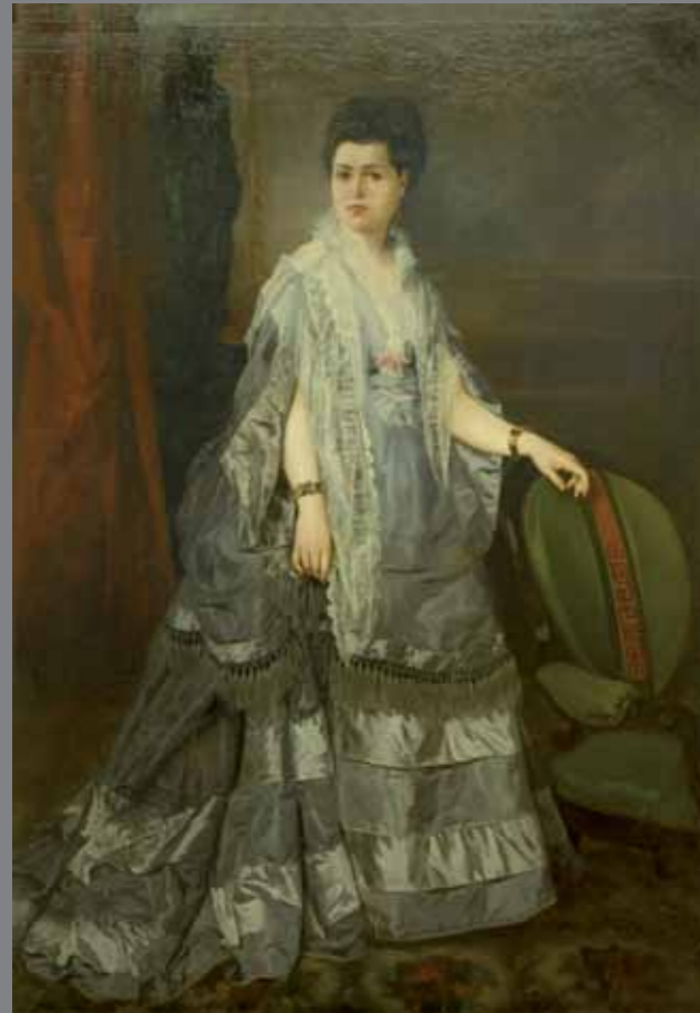
Pintura oli s/tela 138 x 196 cm 1871