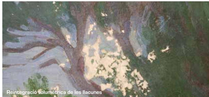
Reintegració volumètrica de les llacunes

Les pèrdues es van anivellar amb un estuc fet de cola animal i carbonat càlcic, en una obra, i amb un estuc fet d'una resina acrílica i carbonat càlcic, en l'altra. En ambdós casos l'estuc va ser aplicat amb un pinzell, amb la superposició de capes fins arribar al nivell de la capa pictòrica.