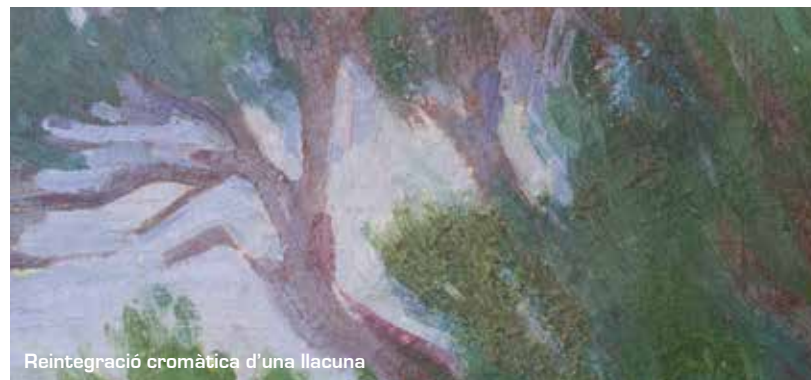
Reintegració cromàtica d'una llacuna

La reintegració es va fer amb aquarel·la, fent que la intervenció fos apreciada de prop però imperceptible de lluny.