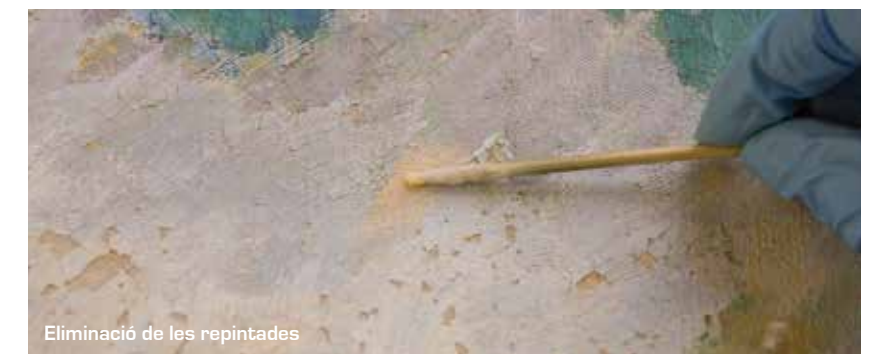
Eliminació de les repintades

La selecció dels dissolvents es va fer a partir de testos de solubilitat; es van utilitzar els dissolvents més efectius per a l'eliminació de les repintades sense que aquests interferissin en els estrats subjacents. Conseqüentment, es van emprar, per una banda, les solucions aquoses tamponades i, per altra, una barreja de dissolvents orgànics.