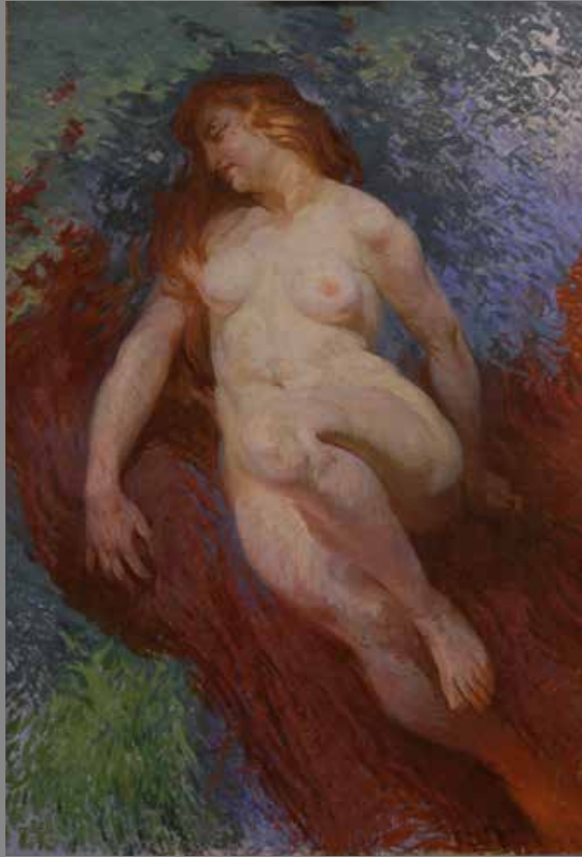
Figura femenina nua Tècnica: Oli sobre tela Mides: 134'5 x 90'3 cm. Autor: Agustí Baiges i Cristòfol Època: Primera meitat del s. XX