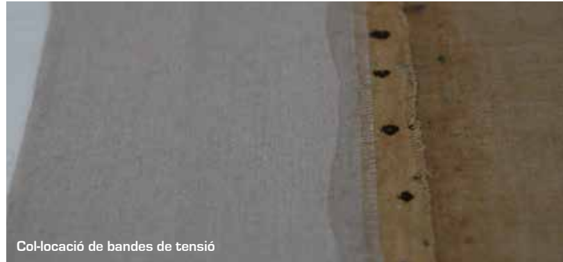
Col·locació de bandes de tensió

A fi de consolidar les vores de la tela, que estaven greument deteriorades i massa febles per permetre el tensat, es van col·locar quatre tires de tela -de característiques similars a l'original- adherides amb resines acríliques.