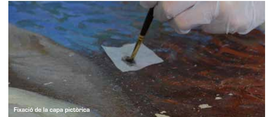
Fixació de la capa pictòrica

En primer lloc es van fixar els aixecaments i els fragments despresos amb alcohol polivinílic i després es va protegir la superfície pictòrica amb l'adhesió d'un paper japonès.