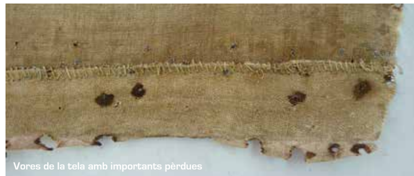
Vores de la tela amb importants pèrdues

Pel que fa a l'estat de conservació, una de les obres tenia el bastidor greument debilitat per l'atac d'insectes xilòfags i les vores de la tela molt febles a causa de les importants pèrdues de matèria i l'oxidació provocada pels gavarrots de subjecció.