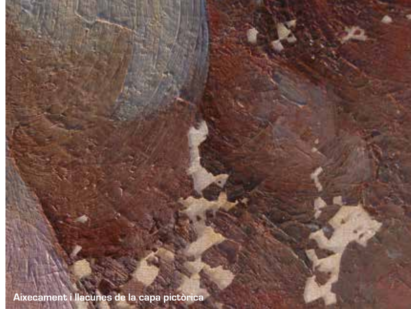
Aixecament i llacunes de la capa pictòrica

Les obres restaurades són dues pintures sobre tela d'Agustí Baiges realitzades a la primera meitat del segle XX. Una d'elles representa una figura femenina nua, mentre que l'altra representa un paisatge. Totes dues obres estan signades i emmarcades. Actualment es conserven al Museu de Tortosa, Històric i Arqueològic de les Terres de l'Ebre.