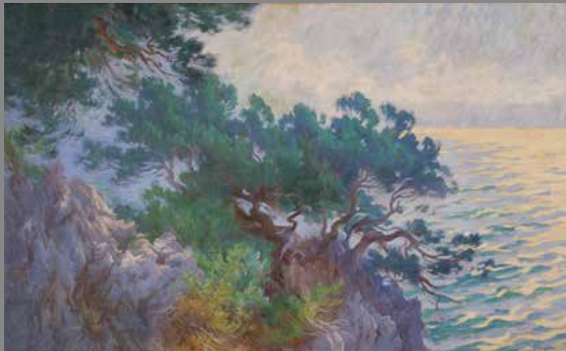
Paisatge Tècnica: Oli sobre tela Mides: 82 x 135 cm. Autor: Agustí Baiges i Cristòfol Època: Primera meitat del s. XX