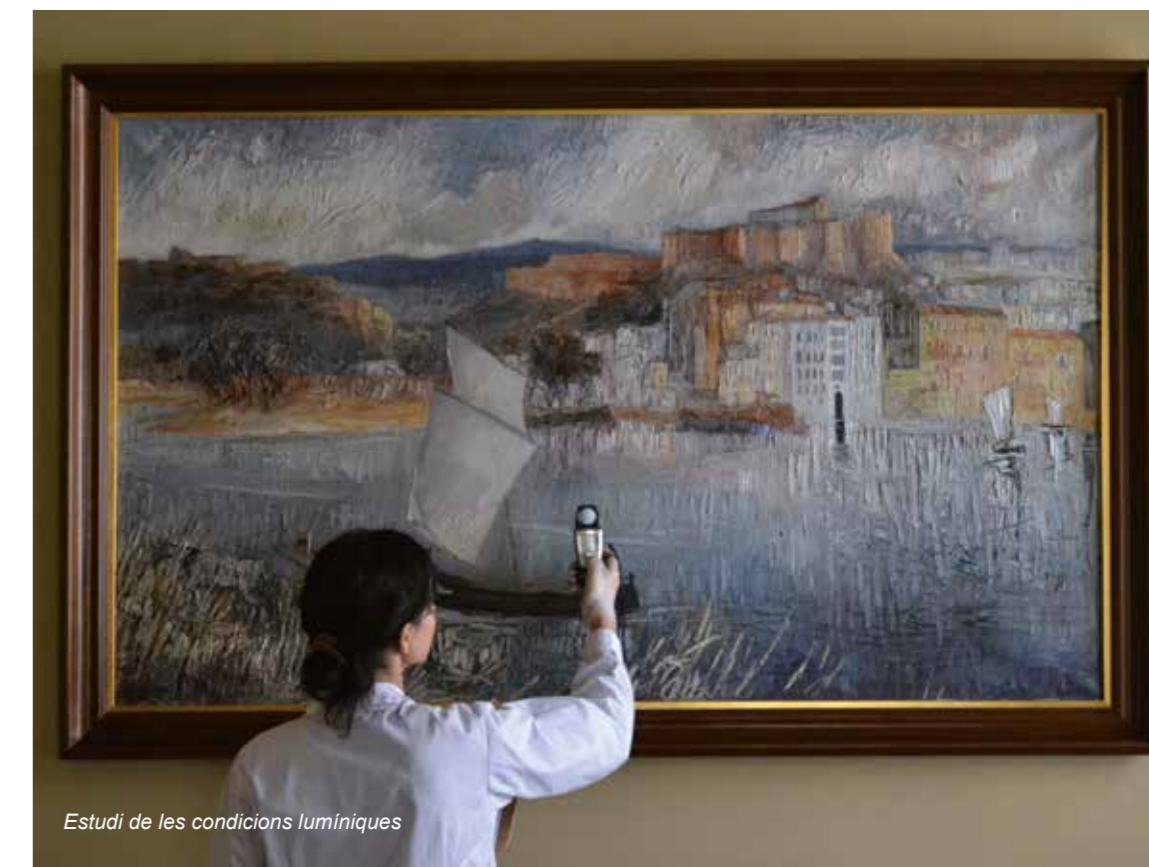
Estudi de les condicions lumíniques