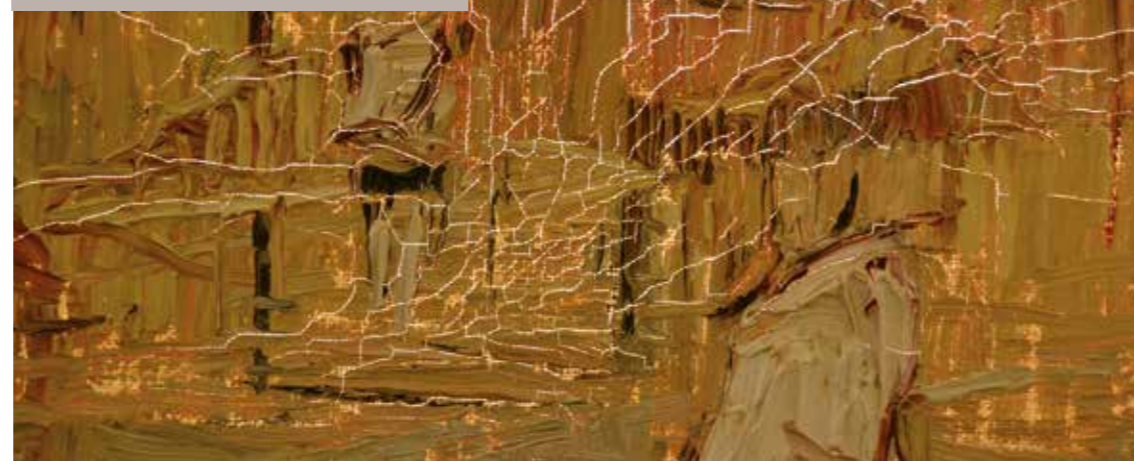
Alteracions de la capa pictòrica

Per a conservar els objectes existeixen dues vies: la prevenció dels danys (conservació preventiva) i la reparació dels danys (conservació curativa)