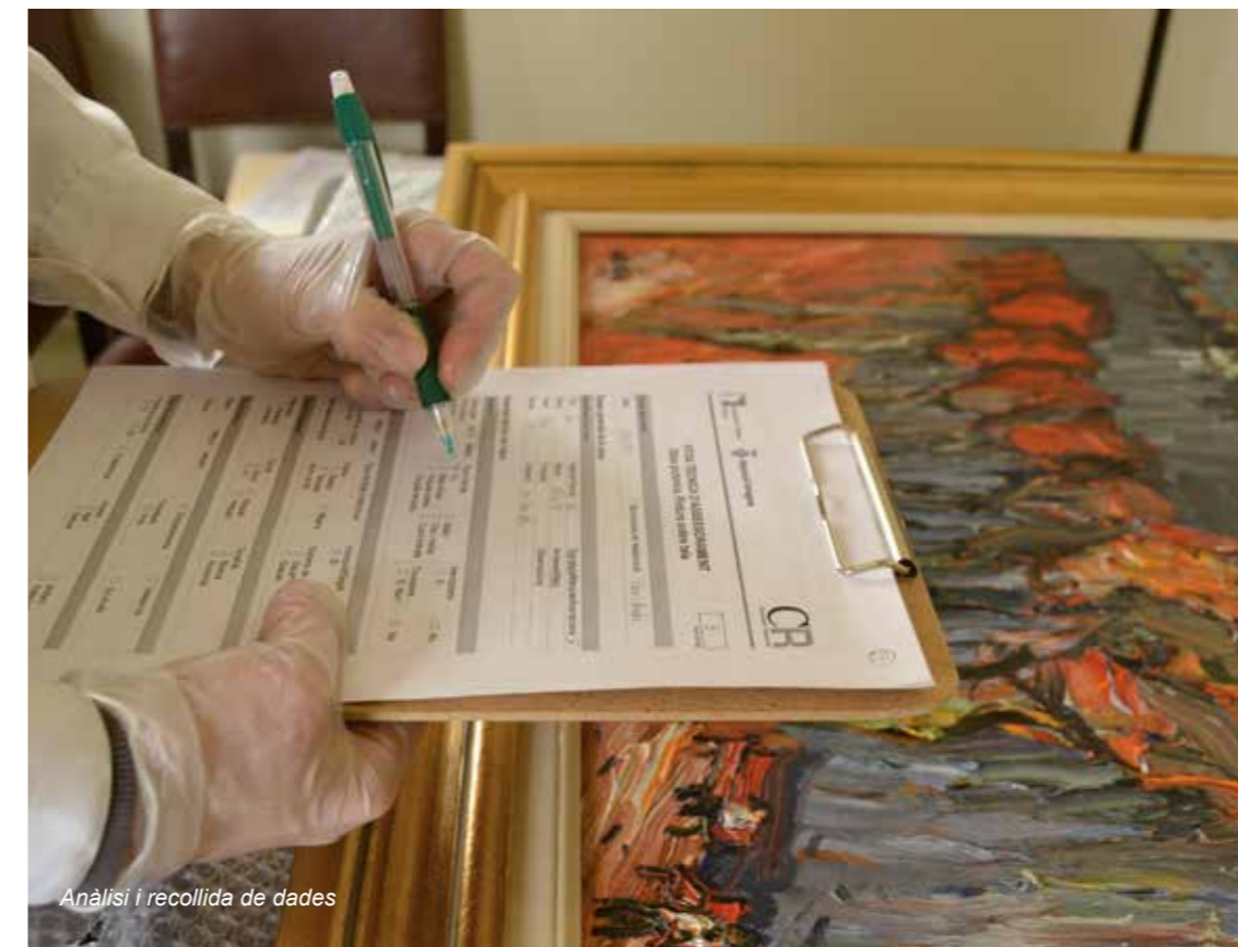
Anàlisi i recollida de dades

Així mateix, uns valors de temperatura i humitat inestables poden causar alteracions de tipus mecànic, com ara clivellats a les capes pictòriques.