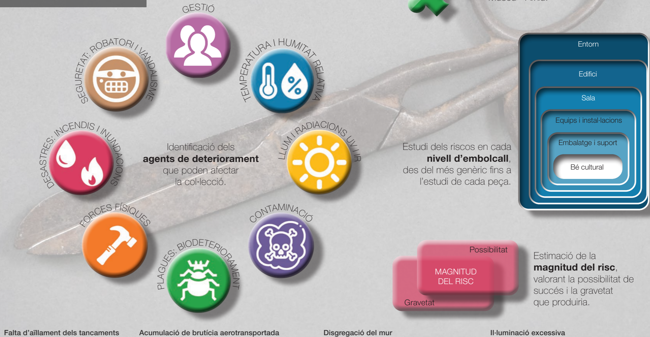
Falta d'aïllament dels tancaments

Identificació dels perills i les amenaces i, estimació del grau de perillositat