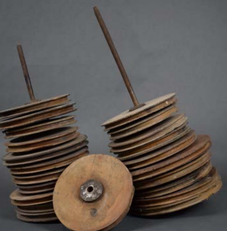
Politges de teler